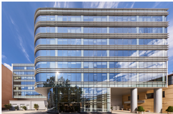
Чапаева улица, д. 15В