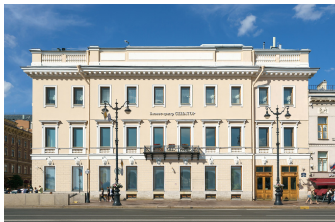
Невский проспект, д. 38