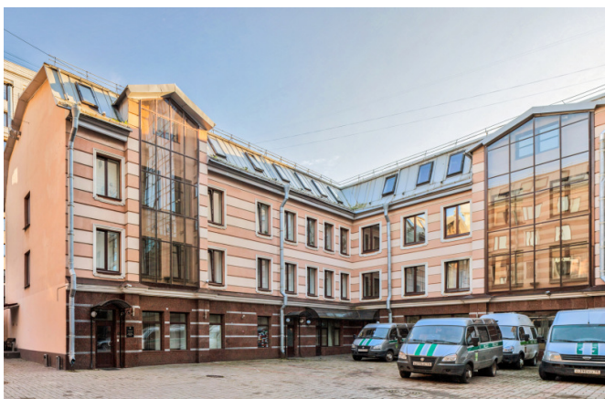
Большой проспект В.О., д. 80Б