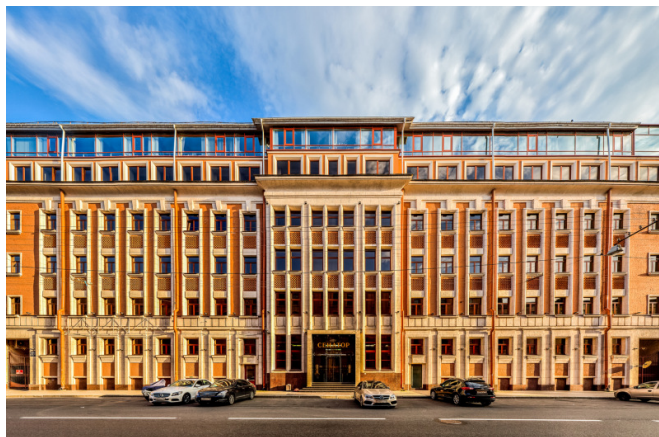
Чайковского улица, д. 1