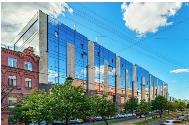
17-я линия В.О., д. 22В