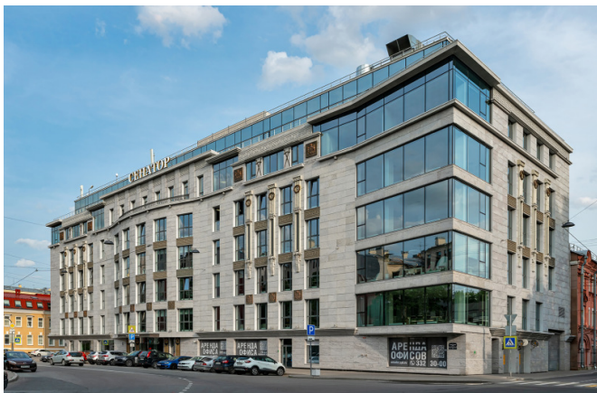
Кропоткина улица, д. 11