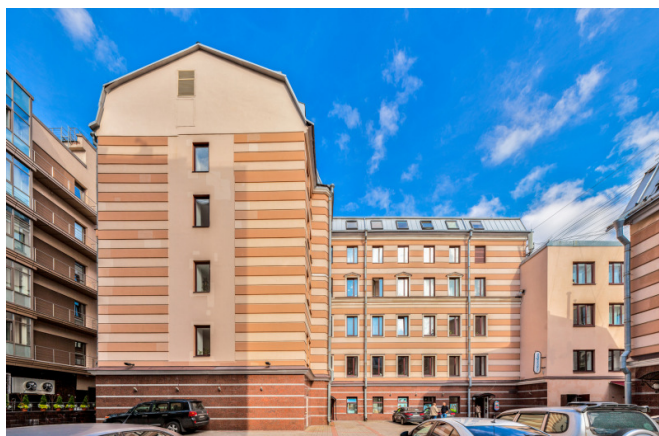
Большой проспект В.О., д. 80А