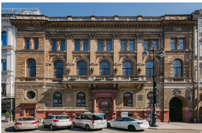
Большая Морская улица, д. 32