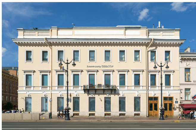
Невский проспект, д. 38