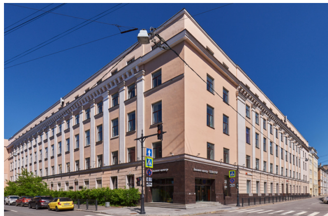
Чапаева улица, д. 15А