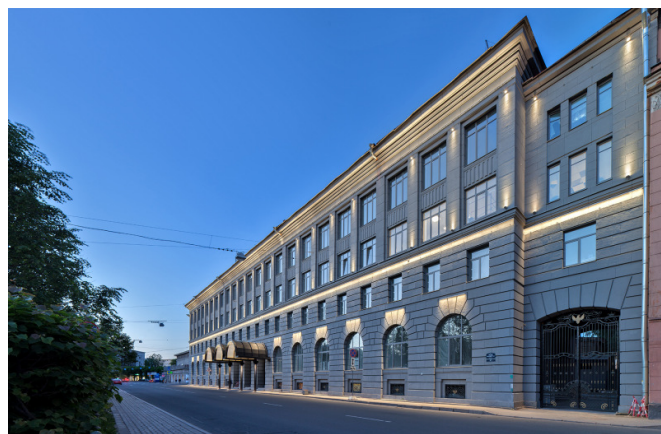
Малый проспект П.С., д. 87