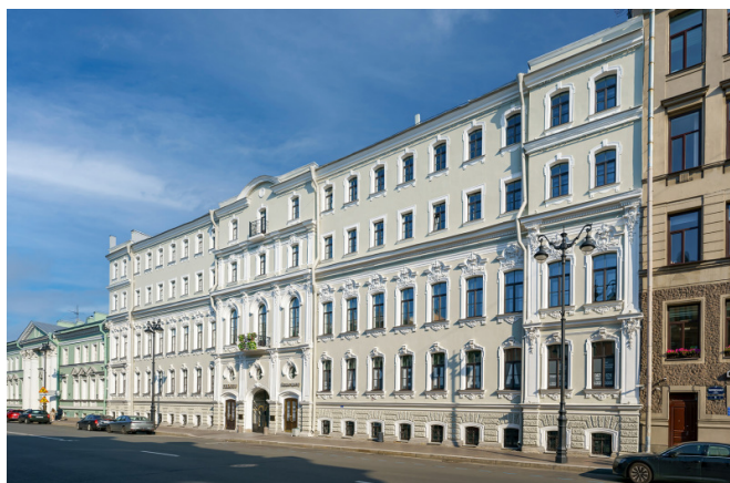
Миллионная ул., д. 6