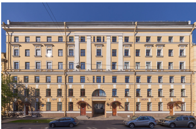
7-я линия В.О., д. 76