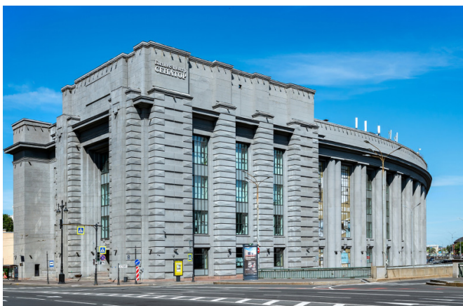
Московский проспект, д. 60