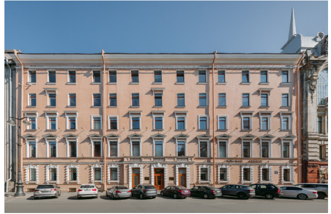
Большая Морская улица, д. 20