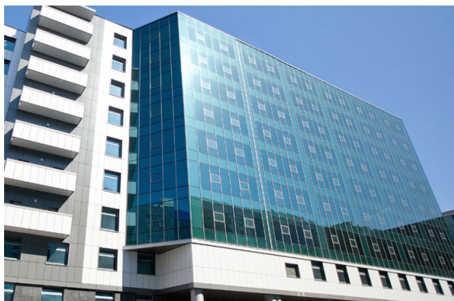
18-я линия В.О., д. 29И