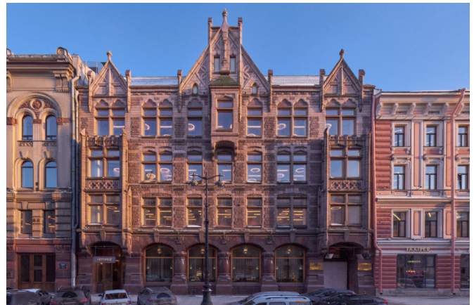
Большая Морская улица, д. 24