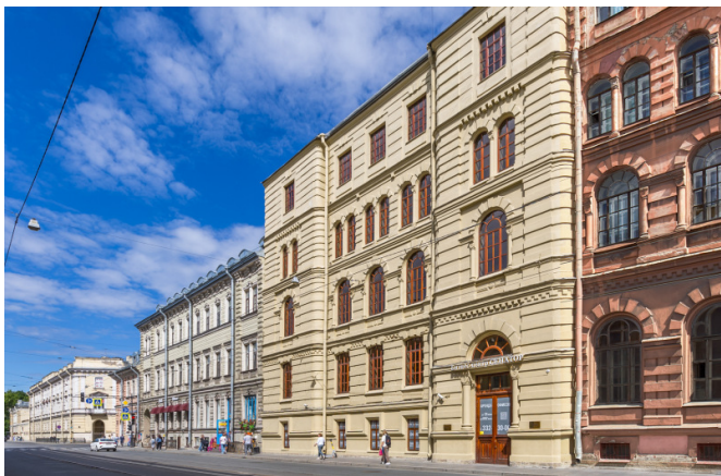
Садовая улица, д. 10