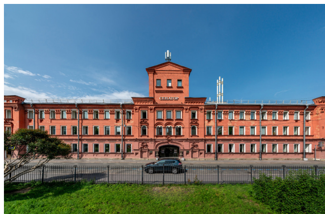
Кропоткина улица, д. 1А