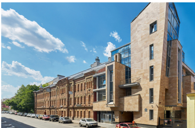
Большая Пушкарская улица, д. 22