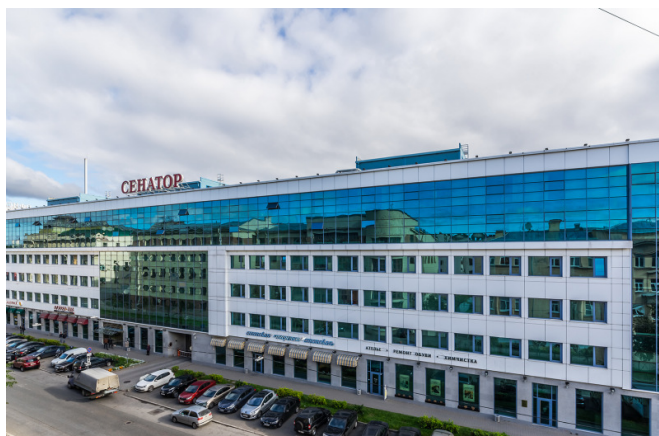
18-я линия В.О., д. 29А