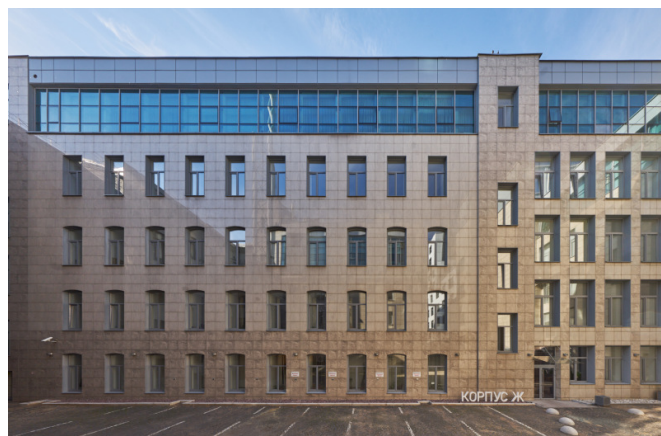
18-я линия В.О., д. 29Ж