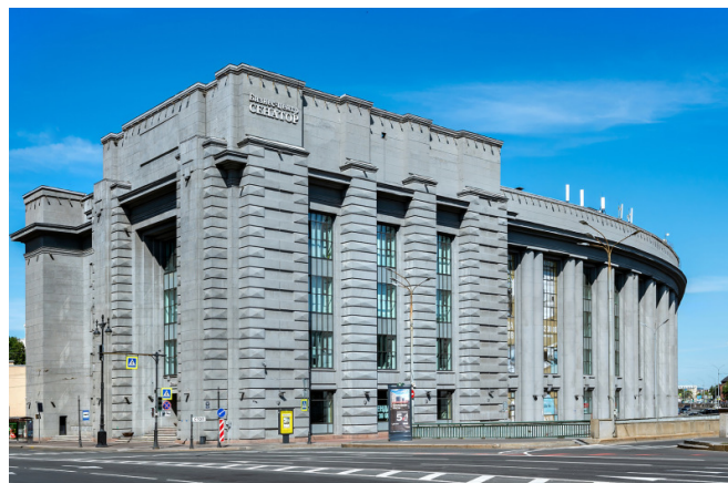
Московский проспект, д. 60