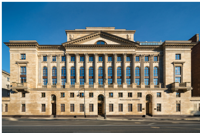
Большой проспект В.О., д. 80Р