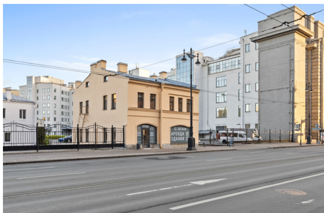
Московский проспект, д. 56