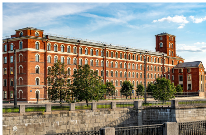
Наб. Обводного канала, д. 60