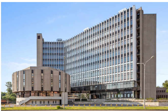
Одоевского ул., д. 24