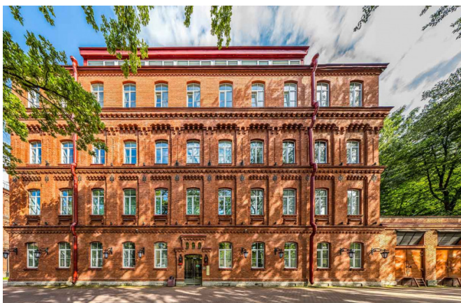
Профессора Попова улица, д. 37А