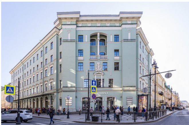
Малая Морская ул., д. 4