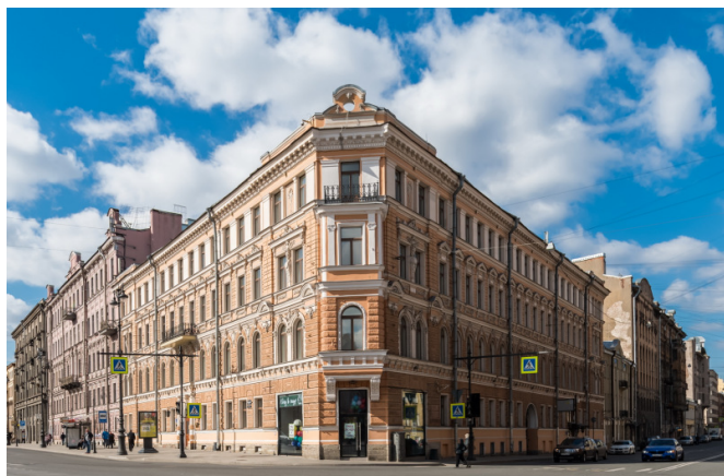
Жуковского улица, д. 63