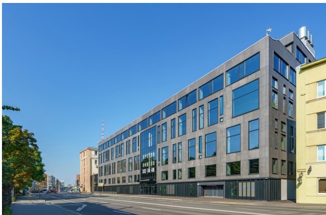
Медиков проспект, д. 7