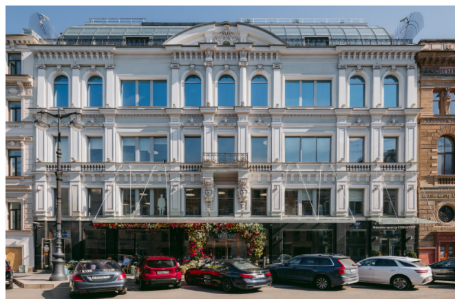
Большая Морская улица, д. 30