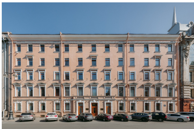
Большая Морская улица, д. 20