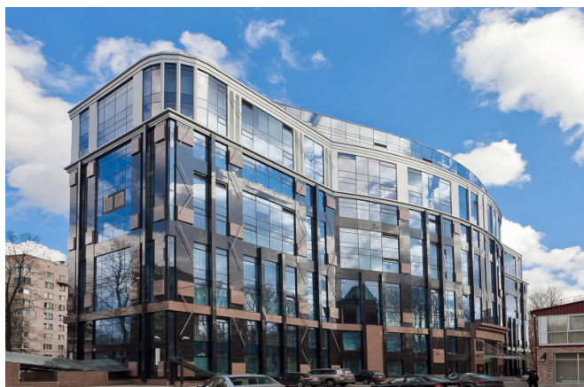
Профессора Попова улица, д. 37В