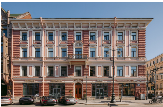
Большая Морская улица, д. 26