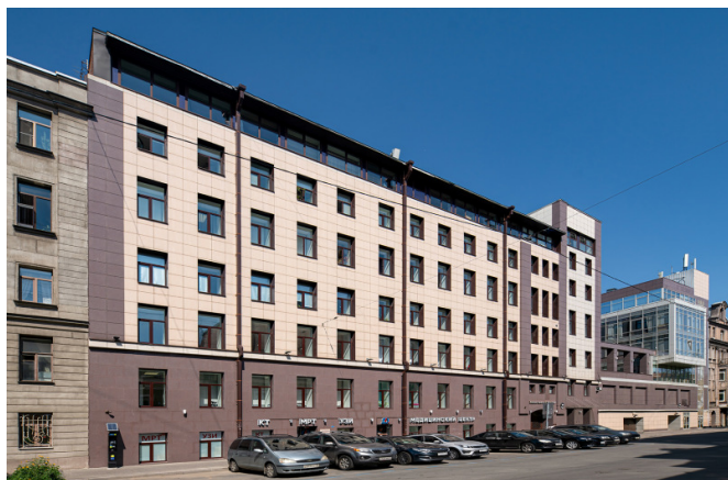
6-я Красноармейская улица, д. 5-7