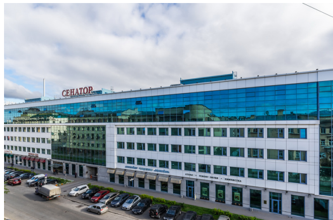
18-я линия В.О., д. 29А