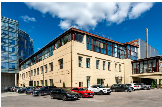
Чапаева улица, д. 15Ж