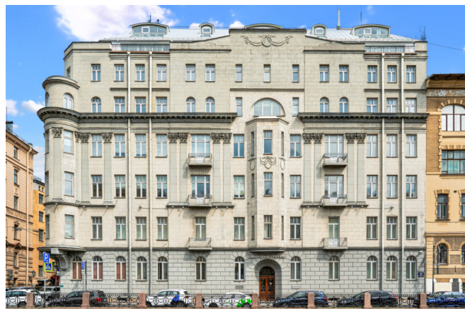
Набережная реки Мойки, д. 36