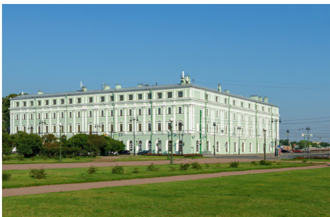
Миллионная ул., д. 5