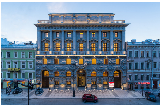
Большая Морская улица, д. 15