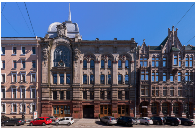
Большая Морская улица, д. 22