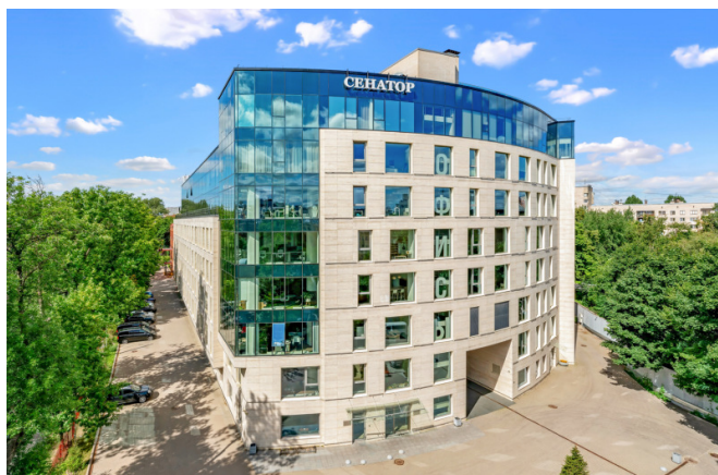
Профессора Попова улица, д. 37Щ