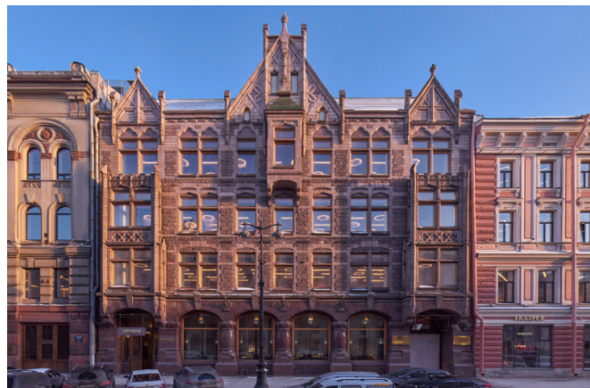
Большая Морская улица, д. 24