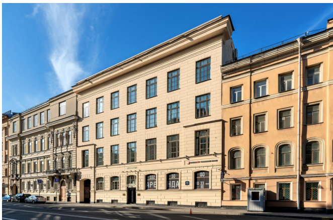
2-я Советская улица, д. 7