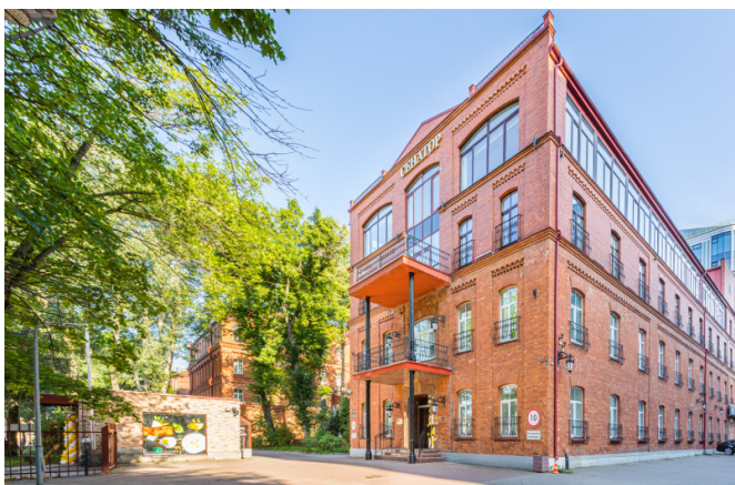
Профессора Попова улица, д. 37Б